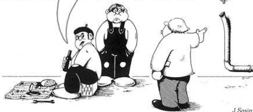
Jacek Sasin, Do Unii i z powrotem .