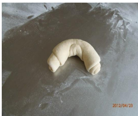
Rysunek 1. Formowanie rogali

Czas na wykonanie zadania wynosi 180 minut.