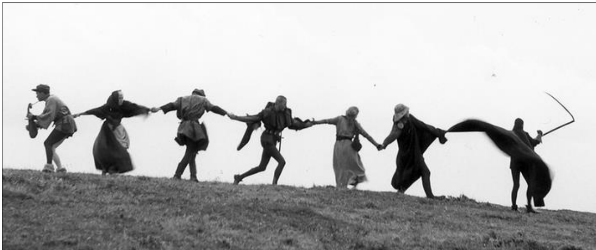
Kadr z filmu Siódma pieczęć, reż. Ingmar Bergman, 1957

Zapoznaj się z poniższym kadrem z filmu Siódma pieczęć w reżyserii Ingmara Bergmana.