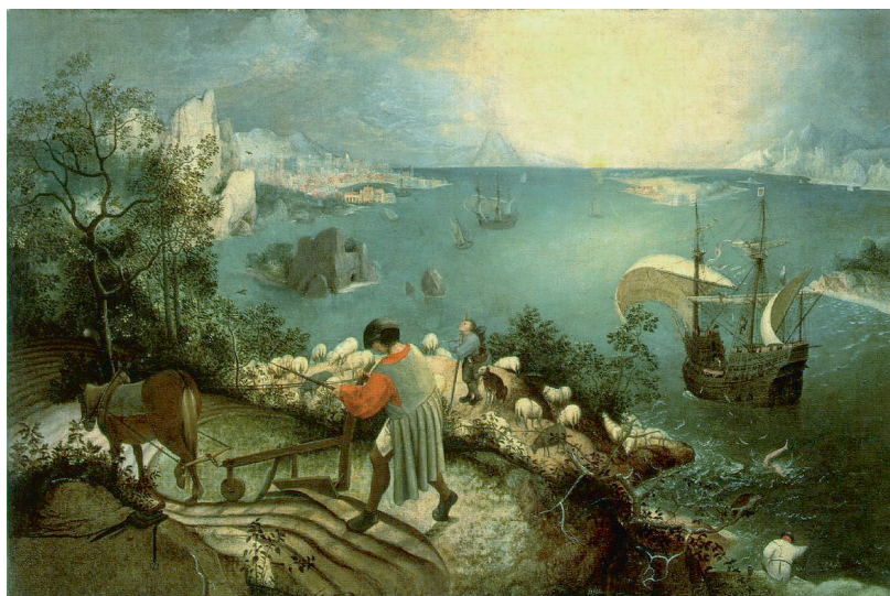
Pieter Bruegel Starszy, Pejzaż z upadkiem Ikara , ok. 1557

Ernest Bryll, Wciąż o Ikarach głoszą... , https://link.operon.pl/oO (dostęp: 5.09.2024).