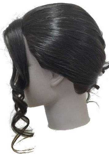
Widok – lewy bok