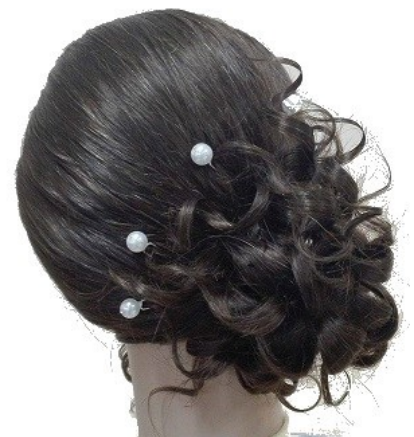
Widok – tył