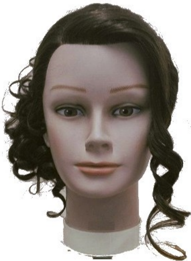
Widok – przód