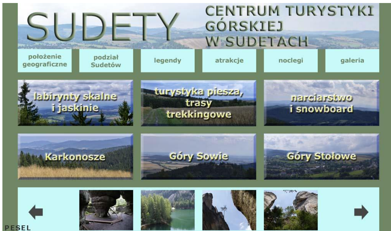
Rysunek 3. Wzór layoutu

Czas przeznaczony na wykonanie zadania wynosi 180 minut.