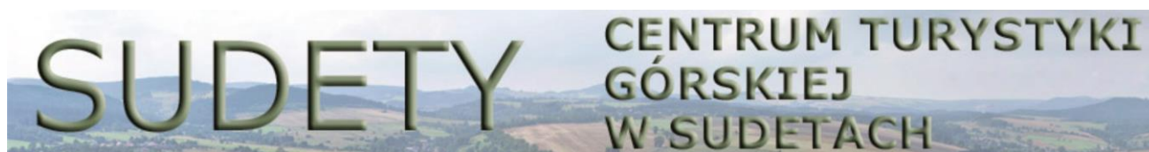
Rysunek 1. Wzór banera