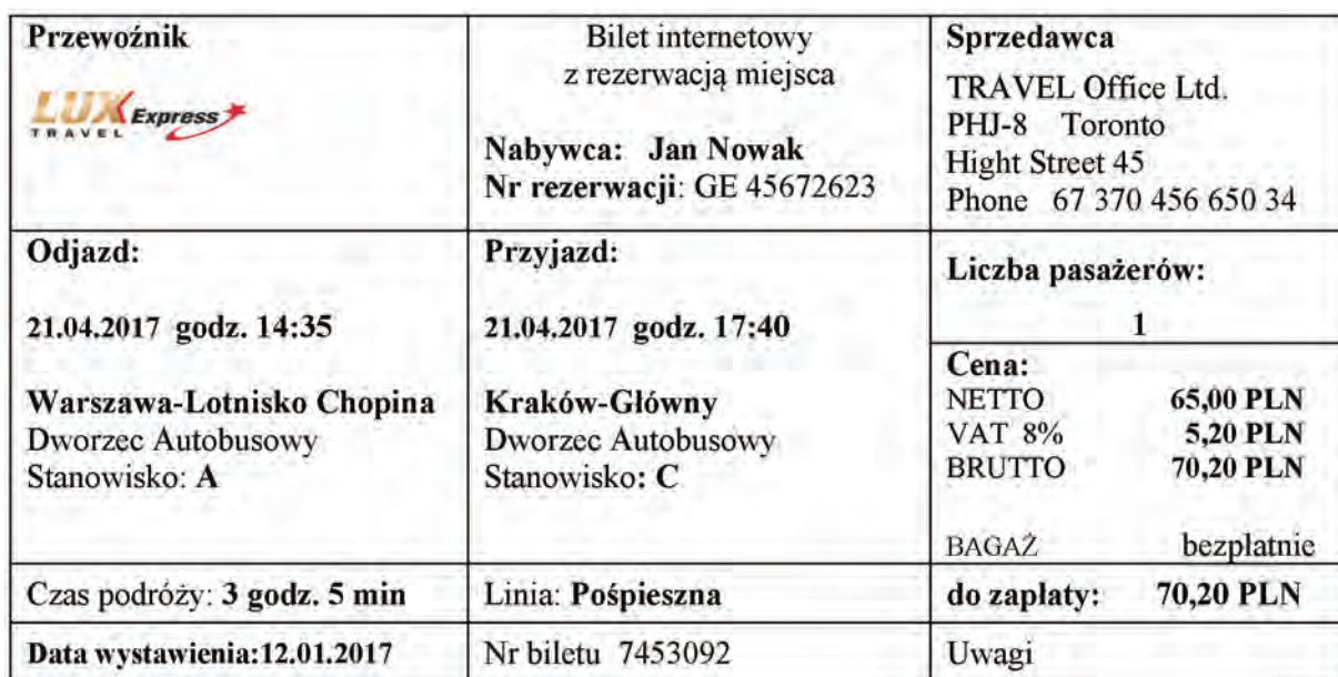
Tabela 3. Wydruk internetowej rezerwacji biletu autobusowego

Na trasie: Toronto-Warszawa różnica czasu 6 godzin