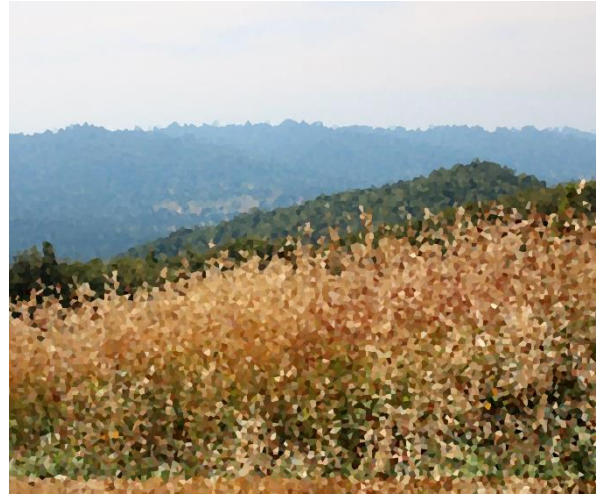
Obraz po zastosowaniu filtra