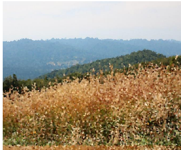
Obraz po zastosowaniu filtra