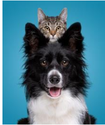
Koty i psy