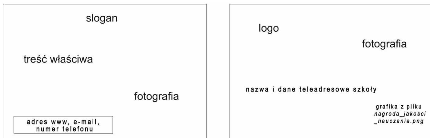
Rysunek 2. Makieta projektu ulotki

UWAGA: Istotnych informacji nie należy umieszczać w obrębie marginesu. Należy zaznaczyć kolorem czerwonym linie rozdzielającą prawą i lewą stronę ulotki.