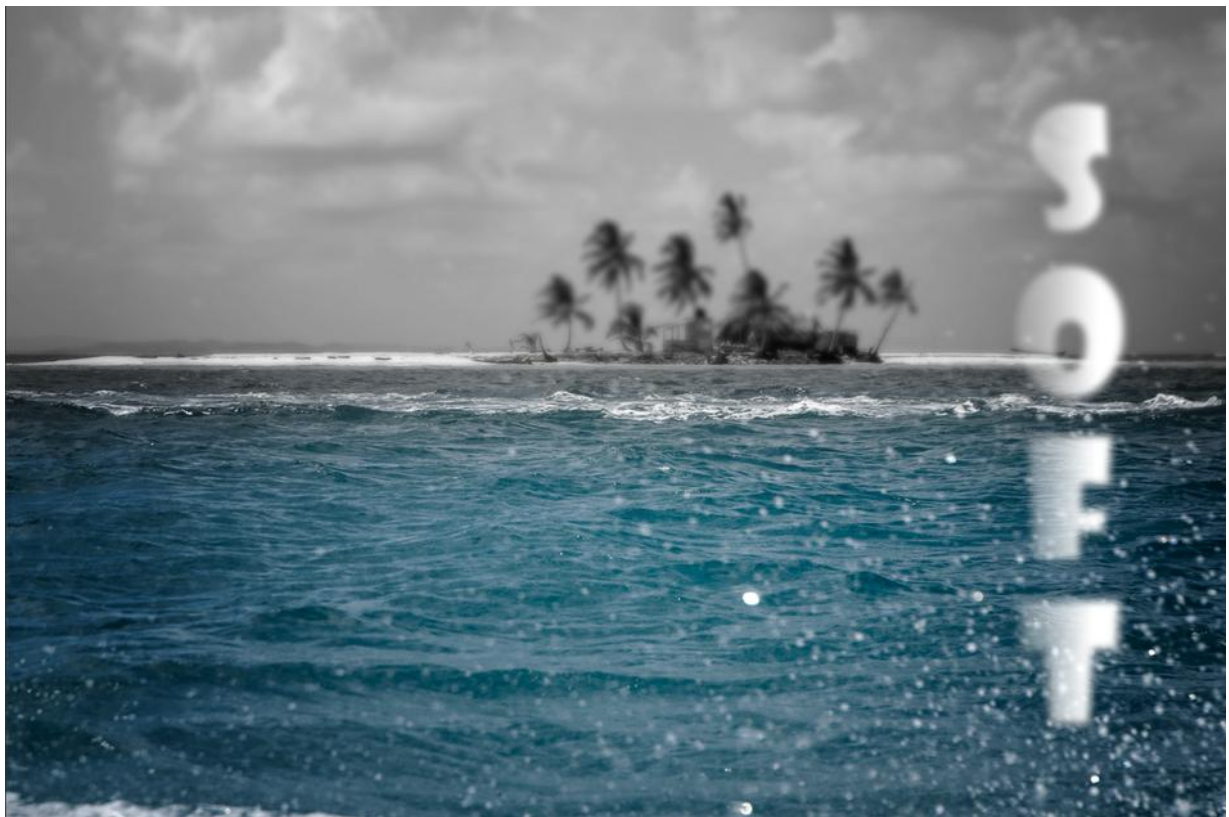
Ilustracja 3. Wzór przygotowania tła