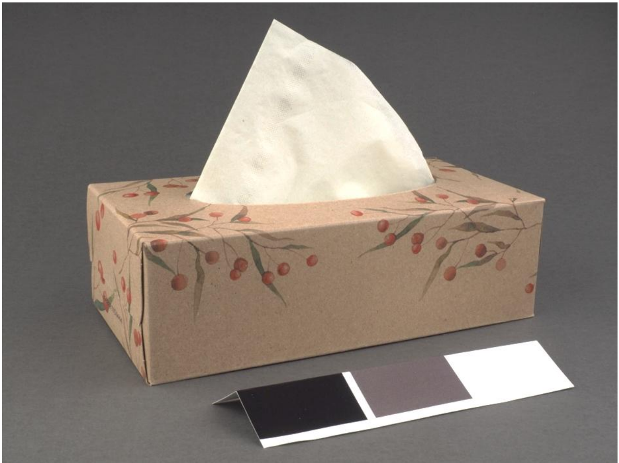
Ilustracja 2. Wzór ułożenia i perspektywy fotografowanego przedmiotu