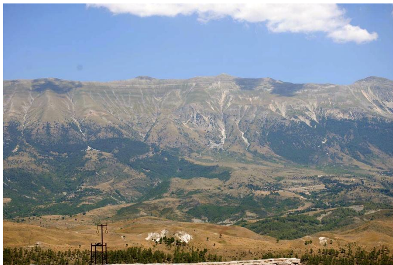
Rysunek 4. Wzór korekty zdjęcia