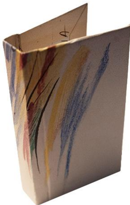
Rysunek 2. Wzór retuszu zdjęcia