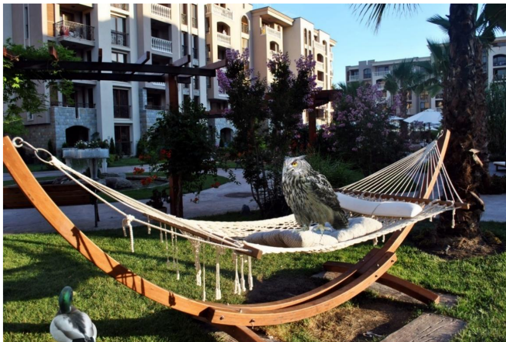
Rysunek 3. Fotomontaż