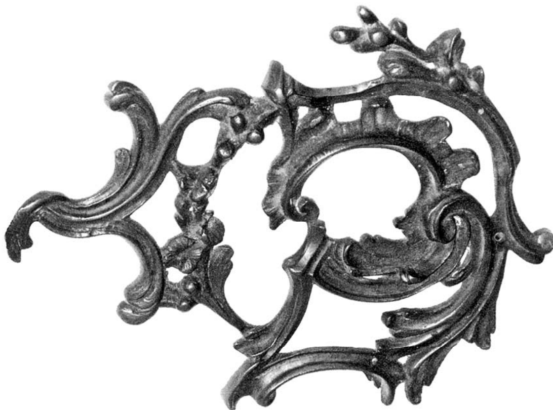
Rysunek 1. Ortogonalny widok sztukaterii.

Po ukończeniu czynności oczyść używane narzędzia i uporządkuj stanowisko pracy.