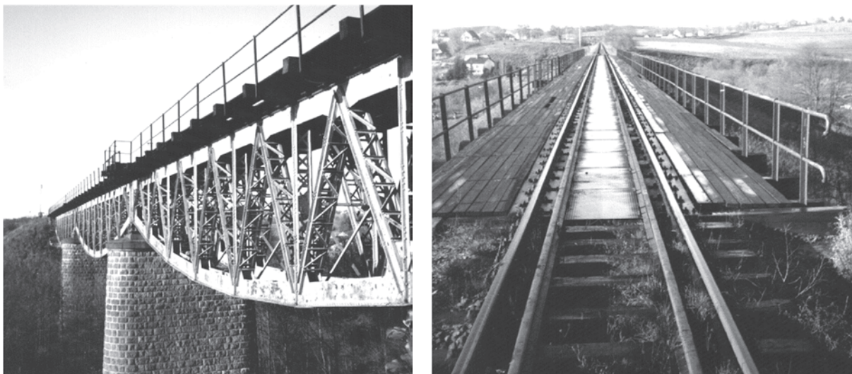
Rysunek 1. Zdjęcia mostu przeznaczonego do remontu

Mostownice oraz bale drewniane na wymianę chodników należy przedmiarować w m 3 .