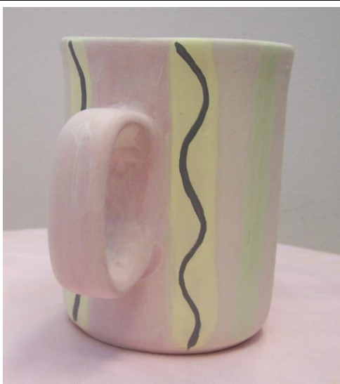
Rysunek 1. Kubek w pionowe linie i pasy – przykład zdobień