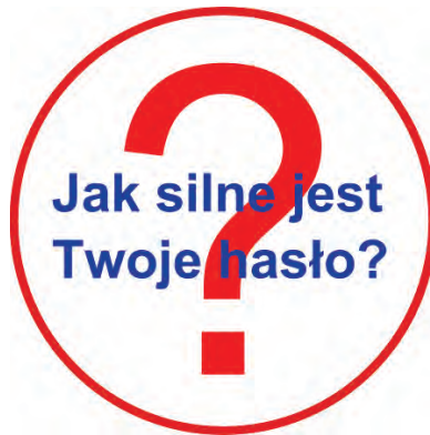
Rysunek 1. Grafika

Witryna internetowa wykorzystuje grafikę, którą należy przygotować i jest ona zgodna z rysunkiem 1.