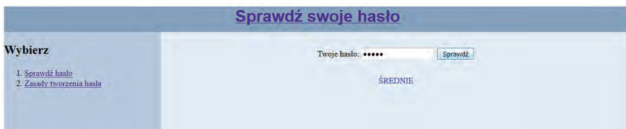
Rysunek 3. Fragment strony haslo.html z efektem działania skryptu

Rysunek 3 przedstawia efekt działania skryptu. Wpisano hasło „qwe12”, zgodnie z tabelą 1 jest ono średnie. Tekst ŚREDNIE w kolorze niebieskim został wyświetlony przez skrypt. Należy zauważyć, że rysunek 3 jest tylko fragmentem wyświetlanej strony.