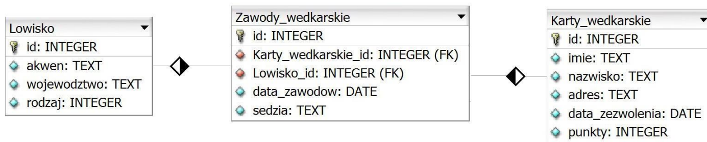
Obraz 1. Baza danych

Fragment bazy danych jest zgodny ze strukturą przedstawioną na obrazie 1. Tabela Zawody_wedkarskie jest połączona relacją z tabelą Lowisko (opisuje łowisko, gdzie będą się odbywać zawody) oraz tabelą Karty_wedkarskie (opisuje wędkarza, który wygrał zawody). Tabela Lowisko zawiera pole rodzaj, którego wartości oznaczają: 1 – morze, 2 – jezioro, 3 – rzeka, 4 – zalew, 5 – staw