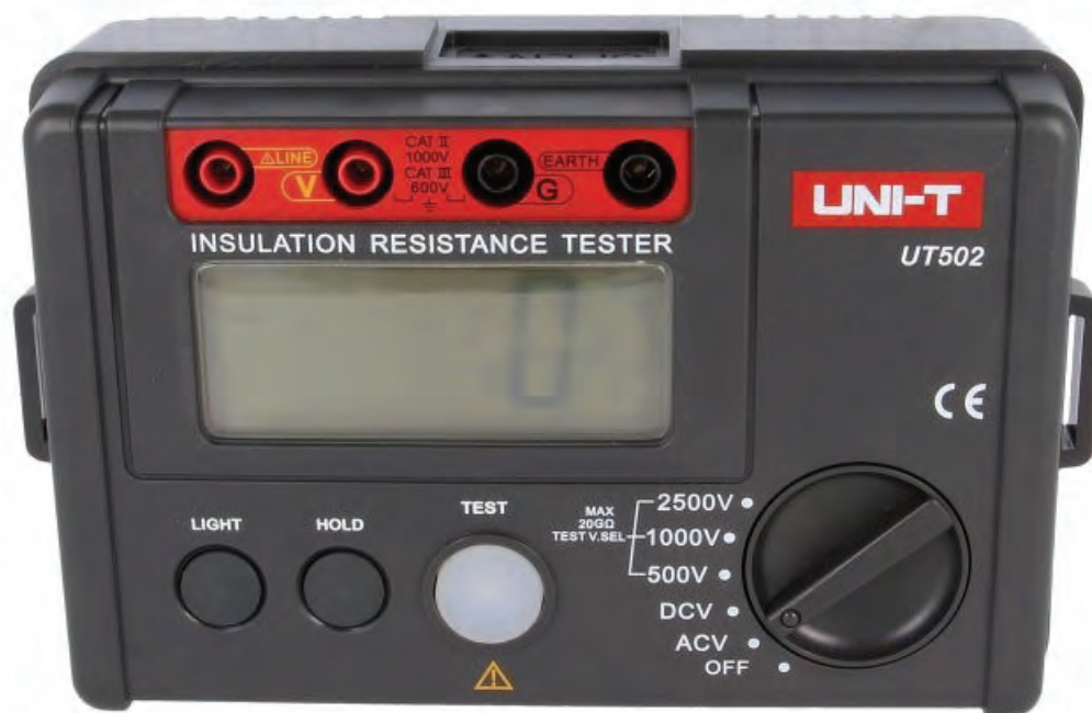
Miernik rezystancji izolacji UT502