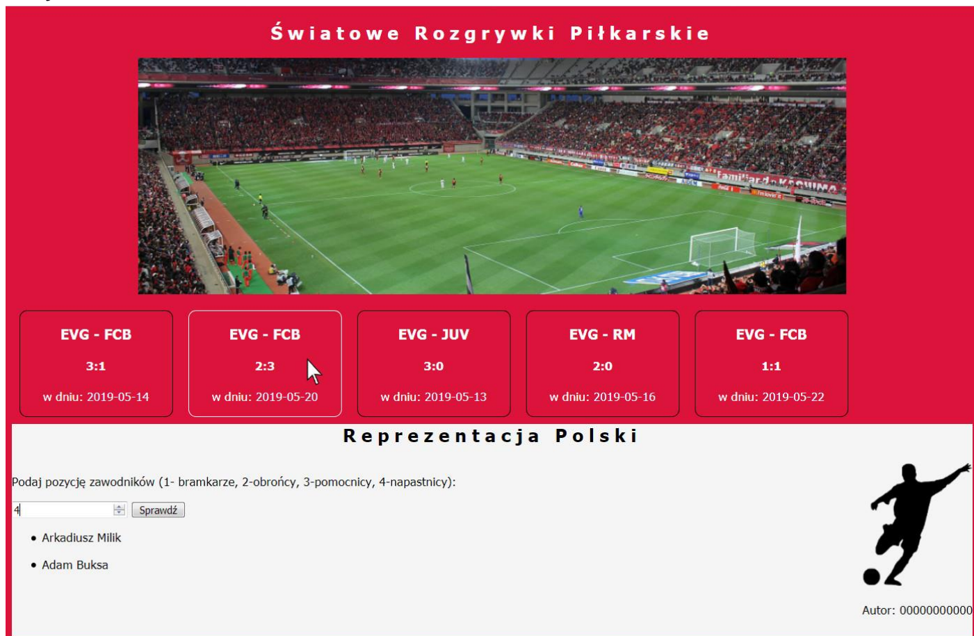
Obraz 2. Witryna internetowa, kursor na drugim bloku informacyjnym, zmienił się kolor obramowania