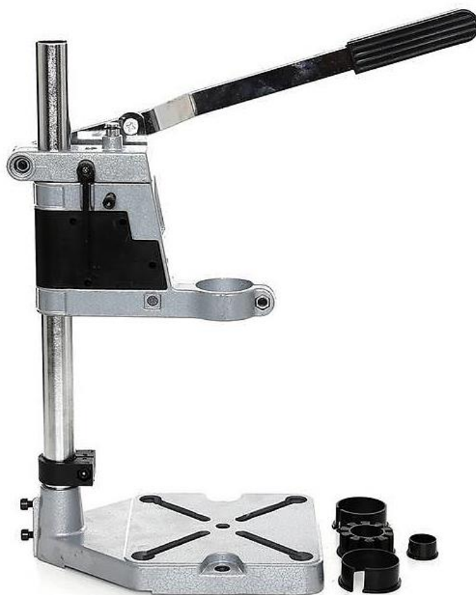
Rysunek 1. Statyw wiertarski – widok ogólny

Wykonaj naprawę i montaż statywu wiertarskiego (rysunek 1) oraz regulację i konserwację. Zamontuj za pomocą wkrętów stopki do płyty drewnianej zgodnie z rysunkiem 2. Podstawę statywu wiertarskiego zamontuj za pomocą śrub na środku płyty drewnianej zgodnie rysunkiem 3. W otworze do mocowania statywu zamontuj wiertarkę z wiertłem o średnicy 5 mm. Naprawę i montaż statywu wiertarskiego wykonaj z zachowaniem zasad bezpieczeństwa i higieny pracy związanych z użytkowaniem narzędzi skrawających i monterskich. Uporządkuj stanowisko pracy. Zakończenie montażu statywu wiertarskiego zgłoś przewodniczącemu ZN.