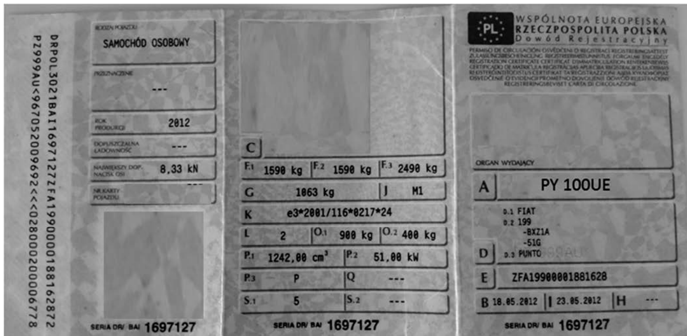
Dowód rejestracyjny pojazdu