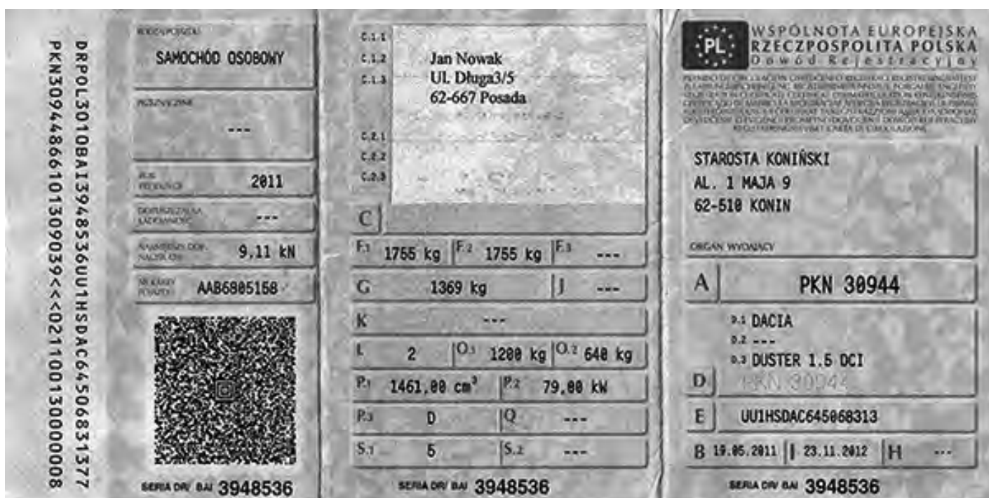
Rysunek 1. Dowód rejestracyjny pojazdu.