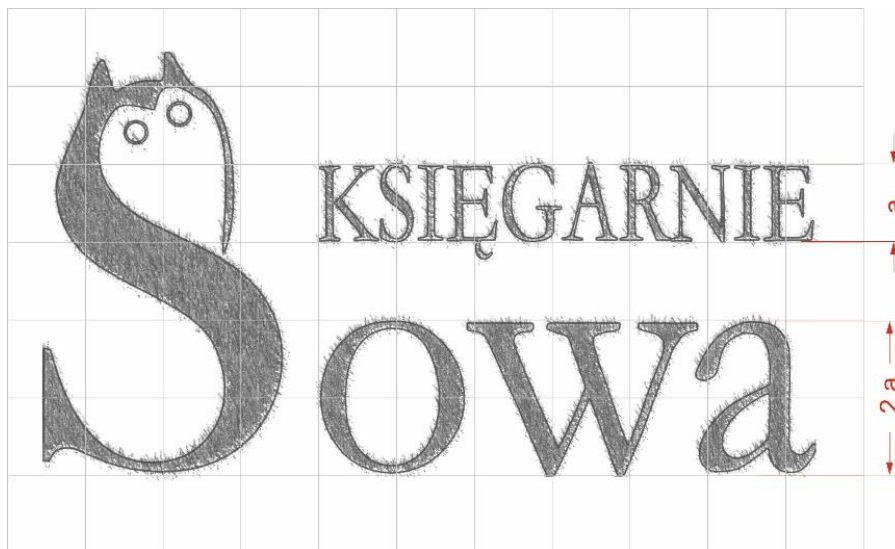
Rysunek 1. Szkic konstrukcyjny logo na siatce modułowej

Gotowy projekt logo zapisz jako plik w formacie PNG o nazwie logo w utworzonym na pulpicie komputera folderze PESEL (PESEL to Twój numer PESEL).