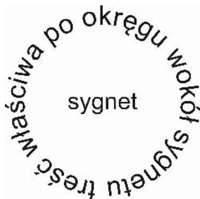
Rysunek 1. Makieta projektu logo

Gotowy projekt logo zapisz jako dokument: