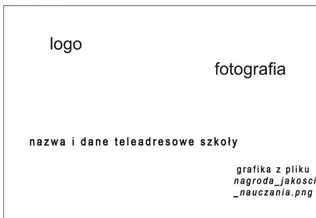
Rysunek 2. Makieta projektu ulotki

Gotowy projekt awersu i rewersu ulotki zapisz jako dokumenty: