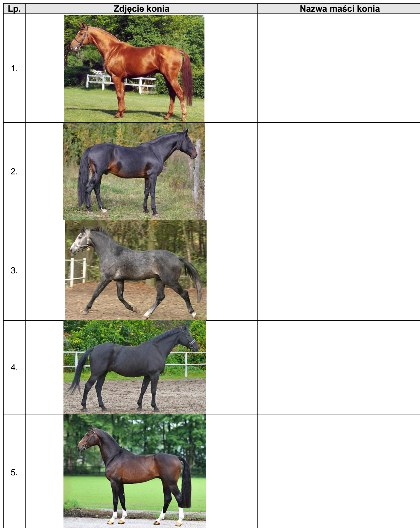
Tabela 5. Maści koni