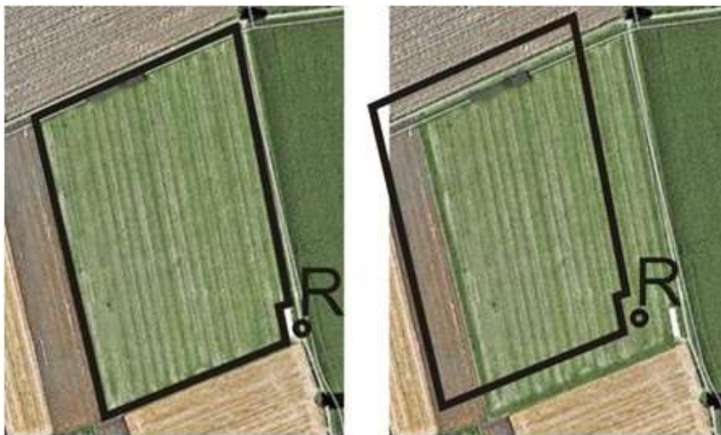
Po lewej – pole ze skalibrowanym sygnałem GPS; Po prawej – pole bez skalibrowanego sygnału GPS

Aby uzyskać wysoką dokładność przejazdu agregatu należy: