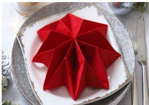
Forma składania 1.

Którą formę składania serwetek należy zastosować, nakrywając stoły do śniadania?