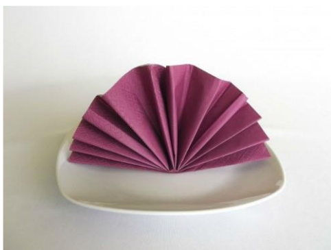
Forma składania 3.