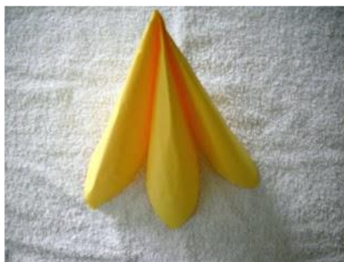
Forma składania 4.