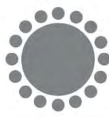
C. Okrągły stół.